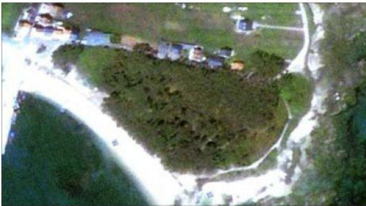
2005. Cabo Furado, como es conocido el paraje, era entonces un pinar del que disfrutaban todos los vecinos.

Ref.: http://www.elmundo.es/papel/2009/01/12/espana/2576051.html