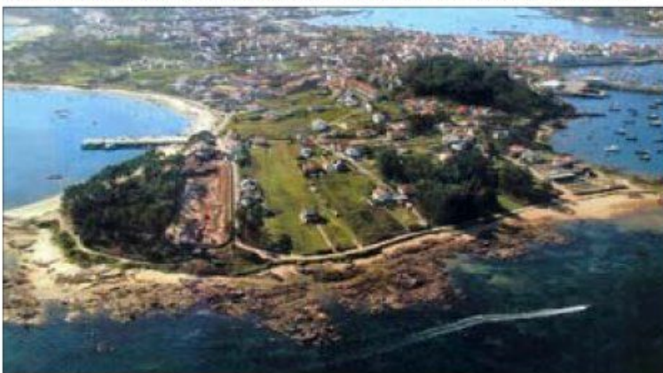
2006. La Xunta de Galicia autorizó que se talaran 280 pinos, casi medio pinar, como se aprecia en la foto.